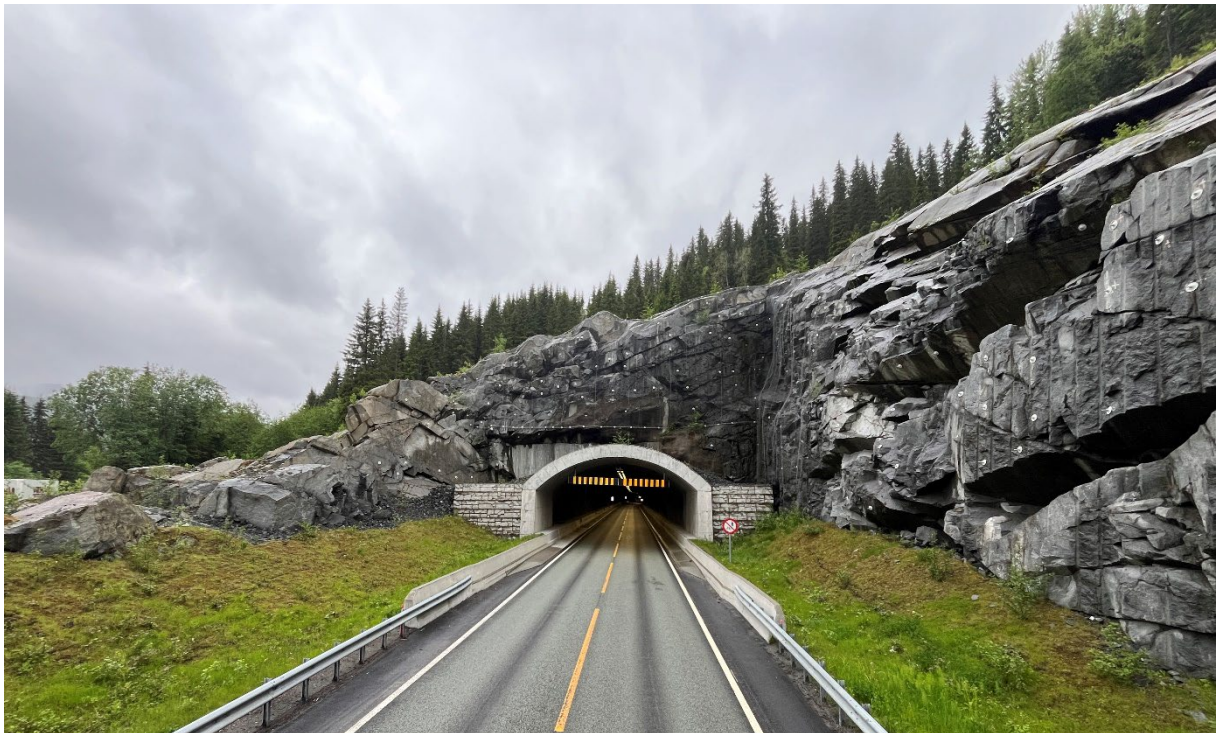
Figur 3: Åsbergtunnelen forskjæring øst.