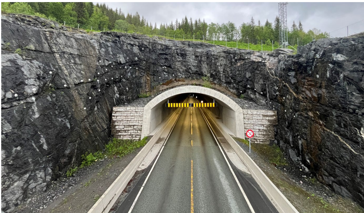
Figur 1: Åsbergtunnelen forskjæring vest.