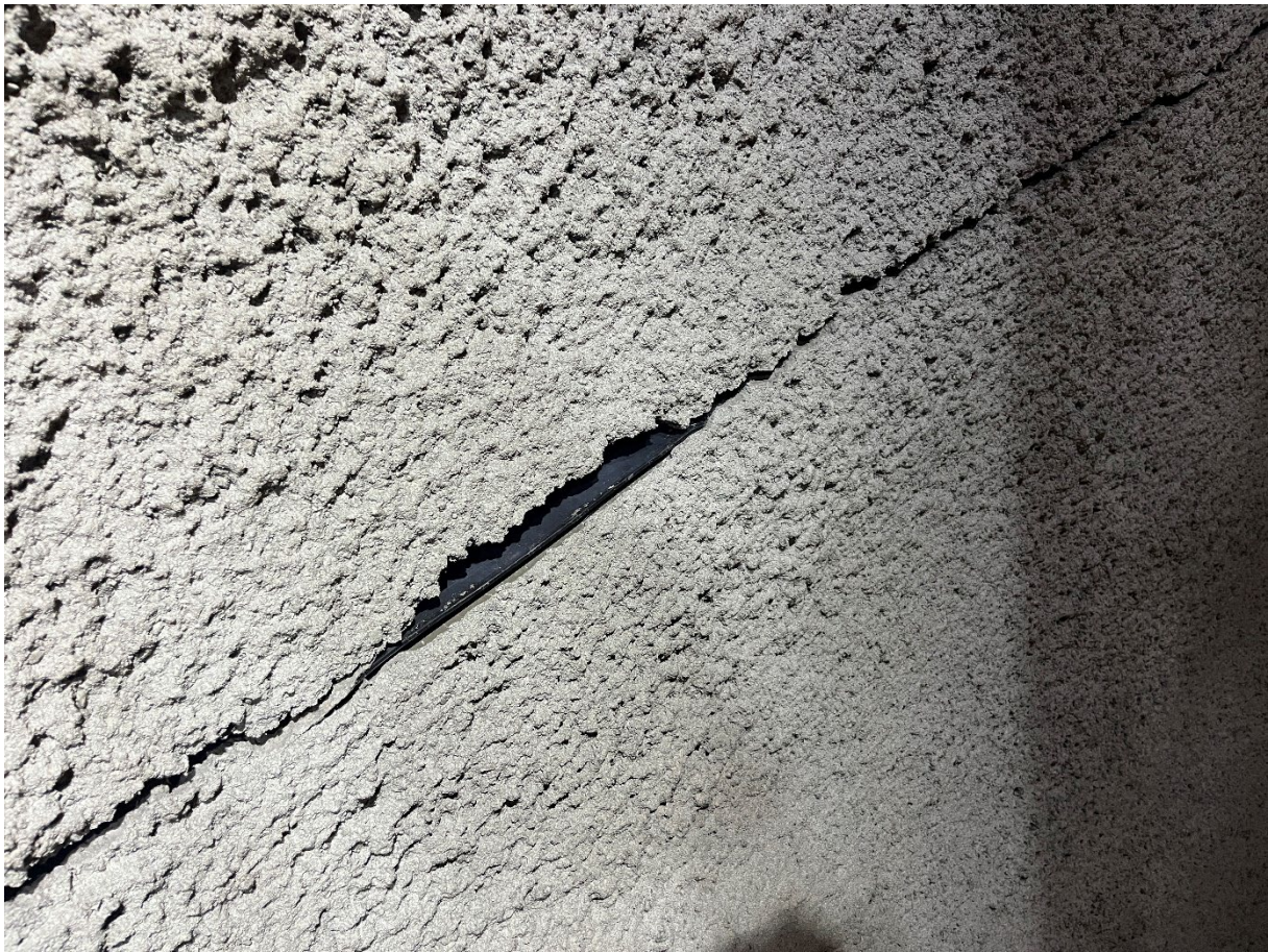
Figur 2: Riss i betong ved pel 365.